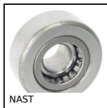
NAST Rotelle. Con anello interno