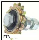
PTR Pignone tendicatena, Per applicazioni correnti