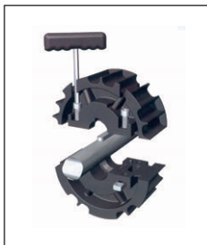
Two part design