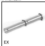
EX Albero per riduttori E, Albero semplice per riduttori E