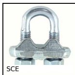
SCE Serracavo, Acciaio