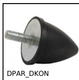
DPAK_DKON Piedino antivibrante parabolico, Acciaio