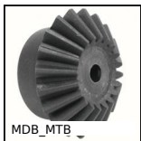
MDB_MTB Ingranaggio conico in plastica stampata , 3:1