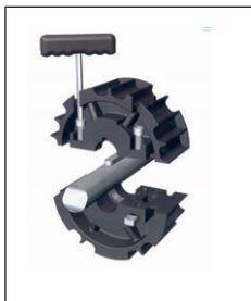
Two part design