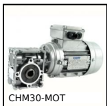
CHM30-MOT Motoriduttore AC asincrono da 0,09 a 0,22kW, 0.09 a 0.22kW