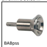
BABpss Perno autobloccante, Inox