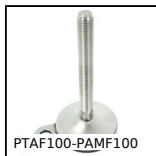
PTAF100-PAMF100 Piede fissabile con base lamiera Ø100, Ø 100