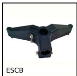
ESCB Base di sostegno, Bipiede combinato