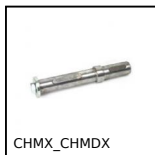
CHMX_CHMDX Albero per riduttore a ruota e vite senza fine CHMR e CHM, Albero se...