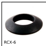
RCX-6 Rondella sferica - DIN6319, convessa