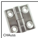
CHAuss Cerniera ad avvitare, 270°