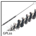
GPLss Scovolo, inox