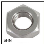
SHN Dado esagonale - DIN934, Acciaio (Class 6|8|)