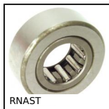
RNAS Rotelle, Senza anello interno