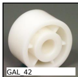
GAL 42 Rullo per trasportatore, Senza cuscinetti a sfere