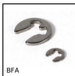
BFA Anelli d'arresto per alberi, Anello tipo E