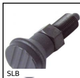
SLB Pistoncino a molla, acciaio classe 5.8