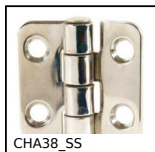
CHA38_SS Cerniera su facciata ad avvitare inox, Su facciata