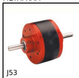
J53 Riduttore coassiale a treni paralleli, da 0.27 a 0.90 - a treni para...