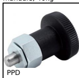
PPD Pistoncino a molla, Per lamiera