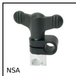
NSA Connettore rinvio d'angolo, Articolato