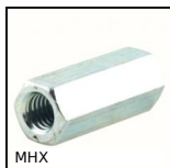
MHX Manicotto esagonale maschiato, Esagonale