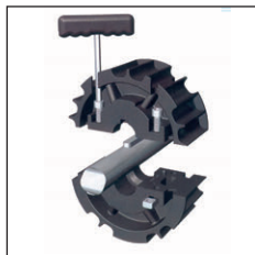
Two part design