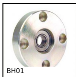
BH01 Cuscinetto radiale flangiato, Montaggio :