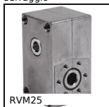
RVM25 Riduttore manuale, Rinvio angolare