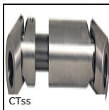
CTss Giunto cardanico telescopico inox, Sollecitazioni leggere