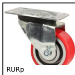
RURp Rotella girevole con piastra, Poliuretano - Mozzo alluminio (Ultra S...