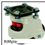
RIMple Ruota di livellamento, Con piastra