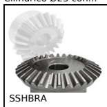
SSHBRA Ingranaggio conico inox, 1,5:1 2:1 3:1