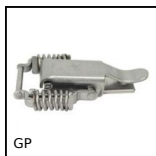
GP Chiusura a leva molla a trazione compensata,