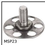
MSP23 Inserto con piastrina a incollare Masterplate®, Cilindrico Ø23 con...