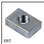
ERT Dado piastrina, Per scanalatura a T