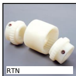
RTN Giunto Bowex®, a dentatura bombata, Nylon