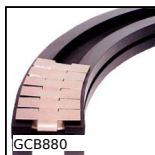
GCB880 Guida curva, Serie 880 e 881