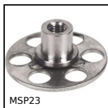
MSP23 Inserto con piastrina a incollare Masterplate®, Cilindrico Ø23 con...