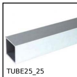
TUBE25_25 Tubo quadrato, Alluminio