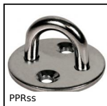
PPRss Piastrina con anello, Inox