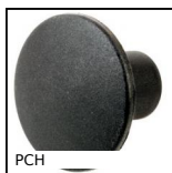
PCH Impugnatura, Fungo