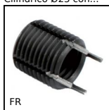
FR Inserti filettati, Acciaio