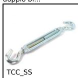
TCC_SS Tenditore, Inox