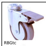
RBGtc Ruota girevole a foro centrale, Acciaio - gomma grigia - a doppio bl...