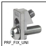
PRF_FIX_UNI Fissaggio, universale