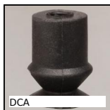
DCA Ventosa, nitrile