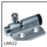
LRR22 Small dimension latch with locking system, Aluminium