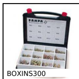
BOXINS300 Inserto autofilettante, Box kit per materiali duri