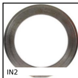
IN2 Ingranaggio interno, Acciaio 20NCD2