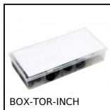
BOX-TOR-INCH Valigetta di guarnizioni toriche in nitrile, For fasteners and fitting