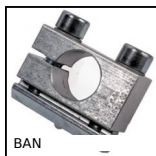
BAN Connettore / supporto per profili alluminio,