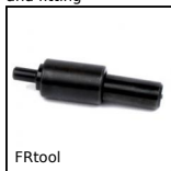
FRtool Attrezzi per inserti filettati, Attrezzo di posa