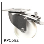
RPCplss Ruota girevole a doppio bloccaggio, Inox - poliammide