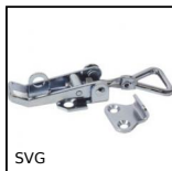
SVG Chiusura a leva regolabile, Corsa da 82mm a 92mm