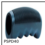
PSPD40 Manopola a pressione, PVC nero