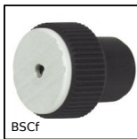
BSCf Manopola, Con coppia regolabile