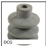
DCG Ventosa, Gomma naturale