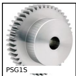
PSG1S Ingranaggio dritto di precisione, Inox 303