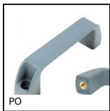
PO Maniglia a ponte - Multi-settore, Foro cieco maschiato