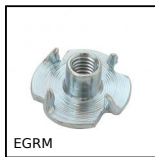
EGRM Tee nuts with prongs,