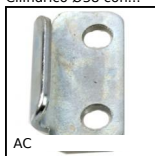
AC Piastrina di riscontro, 13mm