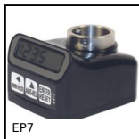
EP7 Indicatore di posizione elettronico, 5 cifre