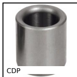
CDP Boccola di posizionamento, Acciaio