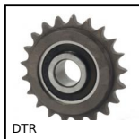
DTR Pignone tendicatena, Ruota dentata in plastica