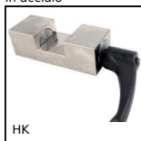
HK Accessorio di serraggio manuale,