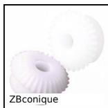
ZBconique Ingranaggio conico in plastica, 1:1