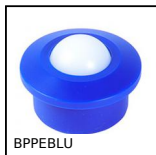
BPPEBLU Sfera portante Agro,