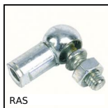
Snodo angolare a 90° DIN71802, Acciaio