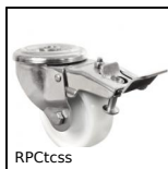
Ruota girevole a foro centrale, Inox - Poliammide - a doppio bloccag...