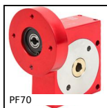
Riduttore a ruota e vite senza fine, fino a