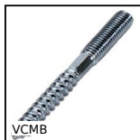
Vite di giunzione metallo/legno, Inox