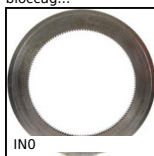
Ingranaggio interno, Acciaio 20NCD2