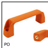
Maniglia a ponte - Multi-settore, Foro cieco maschiato