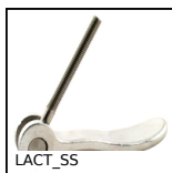
Leva a camma regolabile, Maschio