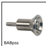
Perno autobloccante, Inox