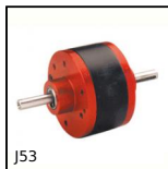
Riduttore coassiale a treni paralleli, da 0.27 a 0.90 - a treni para...