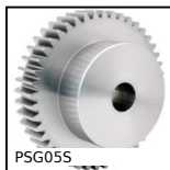
Ingranaggio dritto di precisione, Inox 303