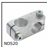
Connettore di serraggio, Incrociata