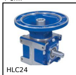
HLC24 Rinvio angolare a dentatura spiroidale, Fino a 78Nm