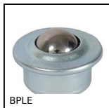
BPLE Sfera portante a incastro, Leggero