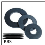
RBS Rondella elastica, Acciaio