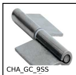
CHA_GC_9SS Cerniera a bandiera inox, A saldare