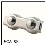
SCA_SS Serracavo, Inox