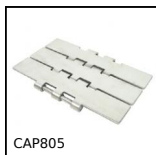
CAP805 Catena a tapparella dritta, Larga serie 805