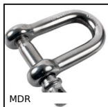
MDR Grillo con chiodo ad occhiello, Acciaio