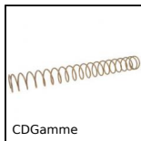
CDGamme Molla di compressione DIN2095, DIN 2095