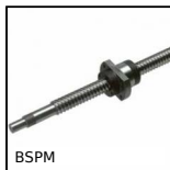
BSPM Vite a ricircolo di sfere miniatura, Dado + vite a ricircolo di sfere