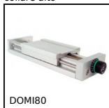
DOMI80 Slitta di regolazione Domino 80, Slitta DOMILINE 80 con contatore e ...