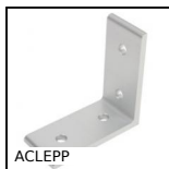
ACLEPP Angolare, 4 fori