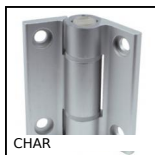
CHAR Cerniera a molla, avvitabile