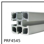
PRF4545 Profilato alluminio standard, 45 x 45 mm