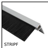
STRIPF Spazzola strip, Lunghezza 1m