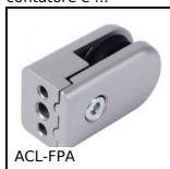
ACL-FPA Accessori per pannelli, Morsetto di fissaggio