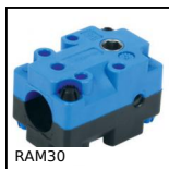
RAM30 Riduttore manuale, Rinvio angolare