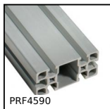
PRF4590 Profilato alluminio standard, 45 x 90 mm