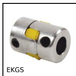
EKGS Giunto senza gioco Gerwah®, da 0.5 a 20 mm