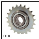
DTR Pignone tendicatena, Ruota dentata in acciaio