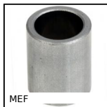
MEF Cuscinetto cilindrico , Lega di ferro FP20 autolubrificante METAFRAM