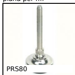
PRS80 Piede snodato tutto inox Ø80, Ø 80