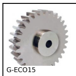
G-ECO15 Ingranaggio dritto acciaio - serie ECO, 20NCD2