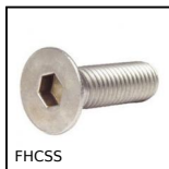
FHCSS Vite a testa svasata piana, Inox A2 - DIN 7991