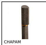
CHAPAM Cerniera a testa piatta a saldare, Acciaio