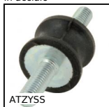
ATZYSS Antivibrante elastico inox sgolato, Inox