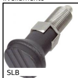
SLB Pistoncino a molla, inox