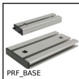
PRF_BASE Elementi di ancoraggio, Basamento