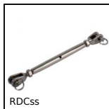
RDCss Tenditore, Inox