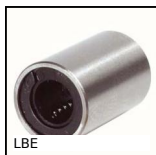
LBE Manicotto a sfere Mini, Miniatura