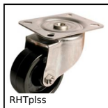
RHTplss Ruota alte temperature, fino a 200kg