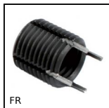
FR Inserti filettati, Acciaio