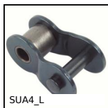
SUA4_L Giunzione per catena al metro, Falsa maglia