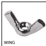
WING Dado ad alette per serraggio manuale, Acciaio (ANSI B18-17)