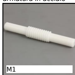
M1 Coppia ruota e vite senza fine, Plastica