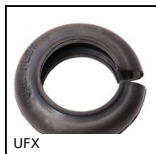
UFX Giunto elastico UNEFLEX, range