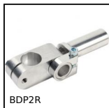
BDP2R Braccio di reazione, Serraggio rinforzato