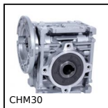
Riduttore a ruota e vite senza fine, fino a 28 Nm