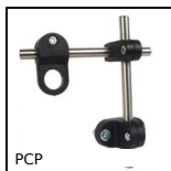
Kit connettori per portacellule, Pre- assemblato