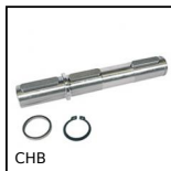
Single output shaft, For CHB gearbox