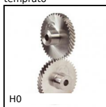
Ingranaggio elicoidale ad assi incrociati a 90°, Acciaio 20NCD2