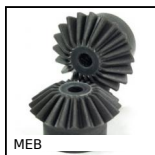
Ingranaggio conico in plastica stampata, 1:1