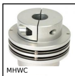
Giunto flessibile a dischi doppi, Disco doppio