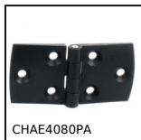
Cerniera ad avvitare estetica simmetrica, Poliammide