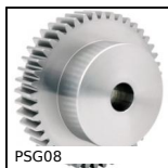
Ingranaggio dritto di precisione, Acciaio 20NCD2 cementato temprato