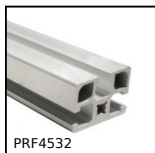
Profilato alluminio standard, 45 x 32 mm