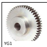
Ingranaggio dritto PRESTAZIONE, Acciaio 35NCD6