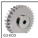
G3-ECO Ingranaggio dritto acciaio - serie ECO, Acciaio C45