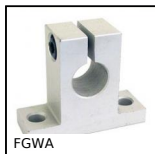
FGWA Supporto per estremità dell'albero, A soletta