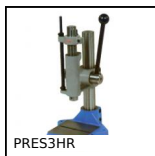
PRES3HR Pressa manuale da banco, Pressione fino a 400kg