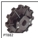
PT882 Pignone di trazione, Serie 882