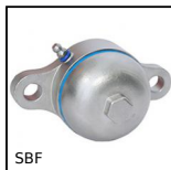
SBF Sealed flange bearing unit for Food Industry, cover