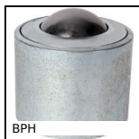
BPH Sfera portante a incastro cilindrico,