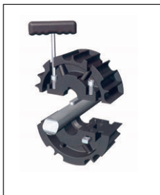
Two part design