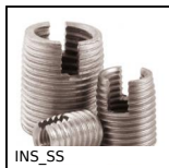
INS_SS Boccola autofrettante Inox, Inox