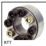
RTT Calettatore di bloccaggio, Coppia