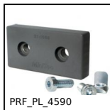
PRF_PL_4590 Elementi di giunzione, Piastra di giunzione - 45x90 mm