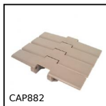
CAP882 Catena a tapparella, Larga serie 882