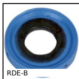
RDE-B Ridondella di tenuta Hygienic Usit®,