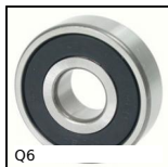
Q6 Cuscinetto radiale a sfere, Acciaio