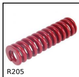
R205 Molla per stampi ISO10243, Forte