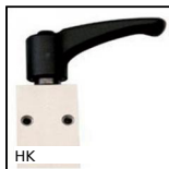
HK Accessorio di serraggio manuale, Serraggio manuale T