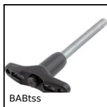
BABtss Perno autobloccante inox 303, Inox 303