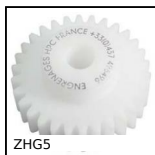
ZHG5 Ingranaggio dritto in plastica, Plastica lavorata (delrin)