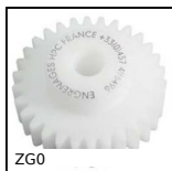
ZG0 Ingranaggio dritto in plastica, Plastica lavorata (delrin)