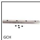
GCH Guida lineare a sfere Eco, economica