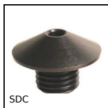
SDC Boccole di posizionamento per