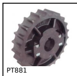
PT881 Pignone di trazione, Serie 881