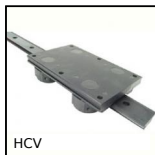
HCV Sistema di guida su binario a V Simple Select®, con carrello