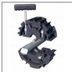
Two part design