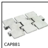
CAP881 Catena a tapparella, Stretta serie 881