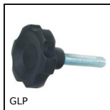
GLP Volantino a 6 lobi, Tecnopolimero - Acciaio