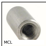
MCL Manicotto cilindrico maschiato, Cilindrico -