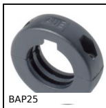
BAP25 Anello di bloccaggio, Ø25 - Ø40