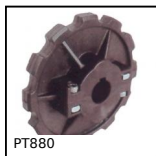
PT880 Pignone di trazione, Serie 880