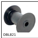
DBL821 Rotella per catena, Serie 821