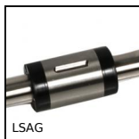
LSAG Albero scanalato a sfere, Carello - da 514