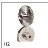
H2 Ingranaggio elicoidale ad assi incrociati a 90°, Acciaio 20NCD2