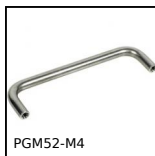
PGM52-M4 Maniglia a ponte, Ottone