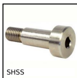
SHSS Vite a spalla inox 416, Inox 416 pretrattato