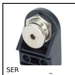
SER Accessori per porte, Fermaporte a calamita