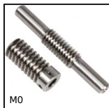
M0 Coppia ruota e vite senza fine , Acciaio non temprato