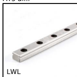
LWL Guida lineare a sfere - Sfere inox, Binario - da 514 N a 16700 N