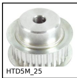
HTD5M_25 Puleggia dentata di trasmissione tipo HTD, HTD5 Alluminio