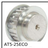
AT5-25ECO Puleggia dentata di posizionamento tipo AT, Serie economica - AT5 al...