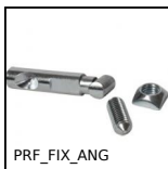
PRF_FIX_ANG Fissaggio, Fissaggio angolare