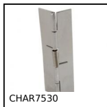
CHAR7530 Cerniera a molla, saldabile