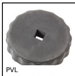
PVL Volantino a lobi, Poliammide