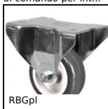
RBGpl Ruota fissa con piastra, Acciaio - gomma grigia