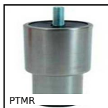
PTMR Telescopic furniture foot, threaded stud