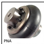
PNA Giunto elastico PERIFLEX®, Giunto completo