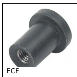
ECF Rivetto rivestito in gomma di fissaggio, Elastomero in