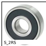
S_2RS Cuscinetto radiale a sfere, Inox