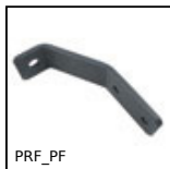
PRF_PF Elementi di ancoraggio, Staffa di fissaggio