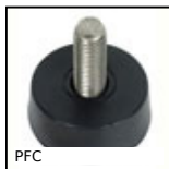
PFC Piede fisso, Livellamento per piccoli elementi