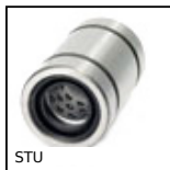
STU Boccola a sfere lineare e rotativa, Acciaio