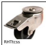
RHTtcss Ruota alte temperature, fino a 200kg