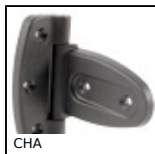
CHA Cerniera, Robusta - Apertura 180°