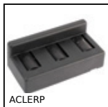
ACLERP Rulliera, Con guida laterale