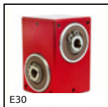
E30 Riduttore a rinvio angolare, da 1.50 a 9 Nm