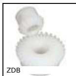
ZDB Ingranaggio conico plastica lavorata (delrin), 2:1