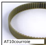
AT10courroie Cinghia chiusa, AT10 Poliuretano armatura in acciaio