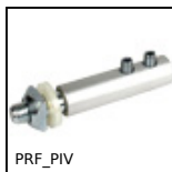
PRF_PIV Cerniere e giunti, Fulcro per porta