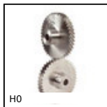
H0 Ingranaggio elicoidale ad assi incrociati, Acciaio 20NCD2