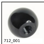
712_001 Impugnatura, sferica