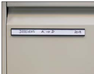
Example of an application on an office filing cabinet