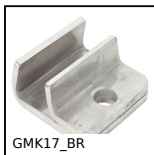
Morsetto porta guide, Conico singolo