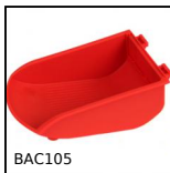
Contenitore a becco, 8mm