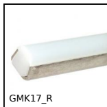
Guida prodotto laterale tonda, Per imbottigliamento e imballaggio