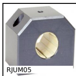
RJUM05 Supporto per boccola Drylin R®, Chiuso -