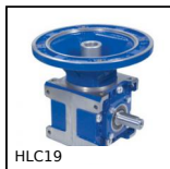
Rinvio angolare a dentatura spiroidale, Fino a 43Nm