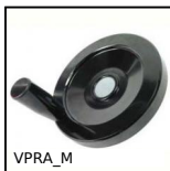
Volantino con impugnatura, Plastica termoidurente - Mozzo:acciaio z...