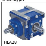
Rinvio angolare a dentatura spiroidale, Fino a 182Nm