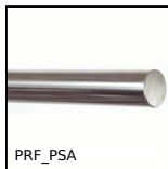
PRF_PSA Rotella per profilo alluminio, Albero per guida