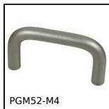
Maniglia a ponte, Alluminio