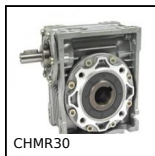
Riduttore a ruota e vite senza fine, fino a 28 Nm