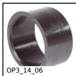
Accessorio per indicatori, Boccola di riduzione