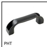
Maniglia a ponte, Fino a 250°C