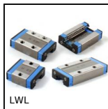
Guida lineare a sfere - Sfere inox, Carello - da 514 N a 16700 N