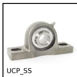
Cuscinetto ritto tutto inox, Inox