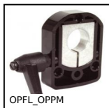
Accessorio per indicatori, Flangia blocco albero