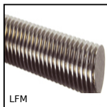
Vite trapezoidale acciaio, Acciaio semiduro - 1 filetto