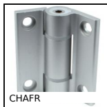
CHAFR Cerniera, A frizione manuale