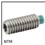
NTM Grano punta in nylon, punta in nylon