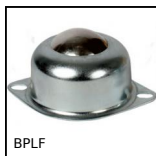
BPLF Sfera portante alta sporgenza, Leggero