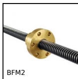
BFM2 Dado trapezoidale, Bronzo - 2 filetti