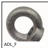
ADL_F Anello di sollevamento, Acciaio