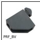
PRF_BV Blocchetto di fissaggio, Aggiunta e fissaggio di pannelli