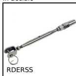
RDERSS Tenditore, a serraggio manuale inox