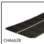
CHASb28 Cerniera senza perno in rotoli, Cerniera in polimero