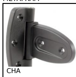
CHA Cerniera, Robusta - Apertura 180°