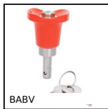
BABV Ball lock pins lockable , Stainless steel