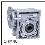
CHM40 Riduttore a ruota e vite senza fine, fino a 57 Nm