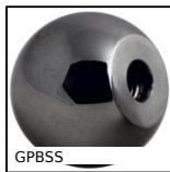
GPB55 Impugnatura sferica femmina filettata, Alluminio