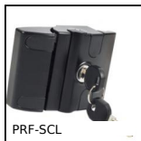
PRF-SCL Sistema di chiusura per profili alluminio, Lock for sliding doors