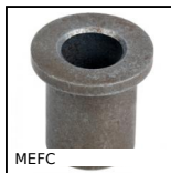
MEFC Cuscinetto a collare , Lega di ferro FP20 autolubrificante METAFRAM