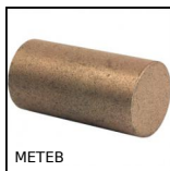
METEB Barre autolubrificanti, Bronzo BP25