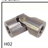
H02 Giunto cardanico semplice ad aghi, Sollecitazioni intense