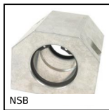
NSB Supporto standard per manicotto chiuso a sfere, Chiuso - Lungo