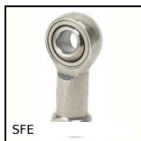
SFE Testa a snodo femmina, Inox / PTFE