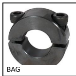
BAG Anello di bloccaggio in acciaio, Acciaio