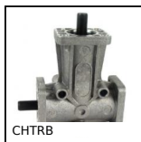
CHTRB Riduttore a rinvio angolare a L o a T, fino a 4,7 Nm