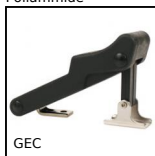
GEC Chiusura a leva in gomma con aggancio, Bloccabile