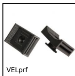
VELprf Supporto clip per rotolo a strappo fermacavi, Poliammide