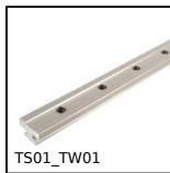
TS01_TW01 Guida lineare su binario Drylin® T, fino al 7000 N