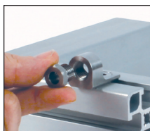
Esempio di applicazione