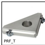
PRF_T Squadra di giunzione, Angolare di rinforzo