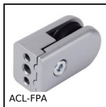
ACL-FPA Accessori per pannelli, Morsetto di fissaggio