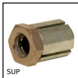
SUP Calettatore di bloccaggio autocentrante acciaio, Senza ghiera