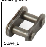
SUA4_L Giunzione per catena al metro, Maglia di giunzione - acciaio