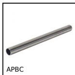
APBC Supporto per sensore, Tubo di collegamento per morsetto