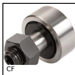
CF Perno folle, Standard - acciaio