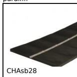
CHAsb28 Cerniera senza perno in rotoli, Cerniera in polimero