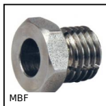
MBF Manicotto filettato di bloccaggio, Montaggio e regolazione rapidi