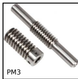
PM3 Coppia ruota e vite senza fine, Acciaio non temprato