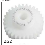
ZG2 Ingranaggio dritto in plastica, Plastica