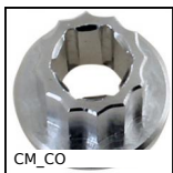
CM_CO Attrezzi Hygienic Usit® and Hygienic