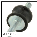
ATZYSS Antivibrante elastico inox sgolato, Inox