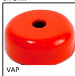
VAP Magnete con foro centrale, Con foro centrale