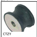
CTZY Antivibrante elastico sgolato, Acciaio