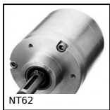
NT62 Riduttore coassiale a treni paralleli, da 6 a 18 Nm - a treni parall...