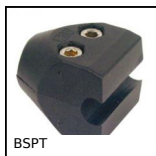
BSPT Morsetto per guide, Rondo