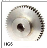
HG6 Ingranaggio dritto acciaio, Acciaio 20NCD2