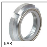
EAR Cuscinetti a sfere - Accessorio, Ghiera autobloccante - anello di fr...