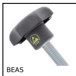
BEAS Star shaped anti- static handle, Star, anti-static