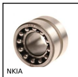
NKIA Cuscinetto combinato con anello interno, Carico assiale monodirezion...