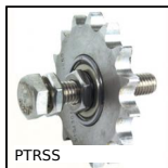
PTRSS Pignone tendicatenena, Per ambienti aggressivi