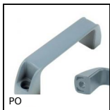
PO Maniglia a ponte - Multi-settore, Foro liscio