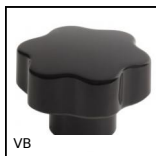
VB Volantino a 6 lobi, Duroplast - Ottone