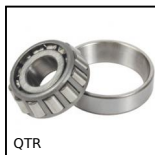
QTR Cuscinetto a rulli conici, Acciaio