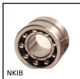
NKIB Cuscinetto combinato con anello interno, Carico assiale bidirezionale