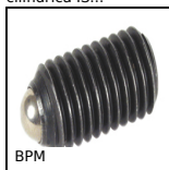
BPM Pressore a molla con intaglio e puntale a