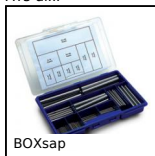
BOXsap Box kit di spine elastiche ISO8752, Box kit - elastica cilindrica IS...