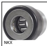
NKX Cuscinetto combinato senza anello interno, Needle and roller bearings