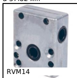
RVM14 Riduttore manuale, A ruota e vite senza fine