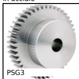
PSG3 Ingranaggio dritto di precisione, Acciaio