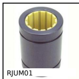
RJUM01 Manicotto a sfere, Drylin® R