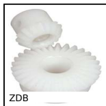
ZDB Ingranaggio conico in plastica, 2:1