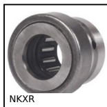
NKXR Cuscinetto combinato senza anello interno, Needle and cylindrical ro...