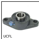
UCFL Cuscinetto a flangia ovale in ghisa, Ghisa