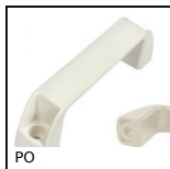
PO Maniglia a ponte - Multi-settore, Foro liscio