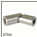
JCSss Giunto cardanico - inox, Sollecitazioni leggere