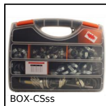
BOX-CSss Fascette di serraggio, Valigetta di fascette inox