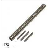
PX Riduttore a ruota e vite senza fine, Albero doppio in uscita per rid...