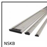
NSKB Guida mini Drylin® N, Rail end cap