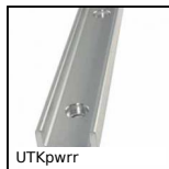
UTKpwrr Guida lineare Utilitrack®, Profilo guida a V