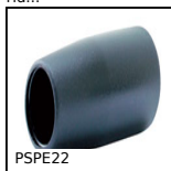
PSPE22 Conical flexible shaft handlee Ø22, Black