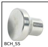
BCH_SS Pomello a fungo inox, M3 a M8