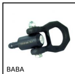
BABA Perno autobloccante, Acciaio