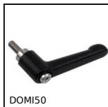
DOMI50 Accessori di collegamento, Leva di serraggio