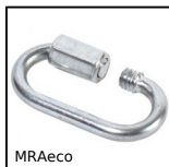
MRAeco Maglia rapida economica, Acciaio