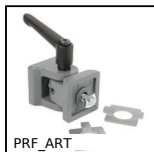
PRF_ART Cerniere e giunti, Con maniglia di serraggio