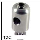
TOC Testa orientabile, Corta