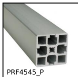
PRF4545_P Profilato alluminio per camera bianca, 45 x 45 mm