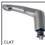
CLAT Maniglia a ripresa Hygienic Usit®, Inox