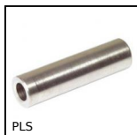
PLS Distanziatore cilindrico, Inox 303