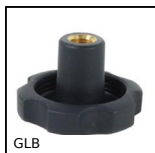
GLB Piccolo volano a 6 alette, Tecnopolimero