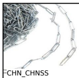
CHN_CHNSS Catena dritta a maglie lunghe, Acciaio zincato