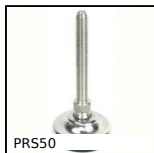
PRS50 Piede snodato tutto inox Ø50, Ø 50