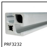
PRF3232 Profilato alluminio standard, 32 x 32 mm