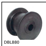
DBL880 Rotella per catena, Serie 880 e 881