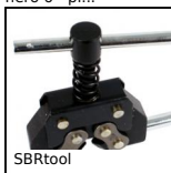
SBRtool Chain tool, Drive chain maintenance tools