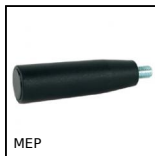
MEP Impugnatura cilindrica libera, Fissa