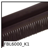
FBL6000_K1 Spazzola al metro fibre PA6 da Ø0,2 a Ø0,3, Poliammide nero 6 - pi...