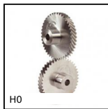
H0 Ingranaggio elicoidale ad assi incrociati a 90°, Acciaio 20NCD2