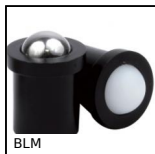
BLM Pressore liscio a molla, Corpo termoplastica