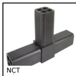
NCT Giunto di collegamento, Ad angolo fisso