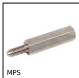
MPS Distanziatore esagonale, Inox 303