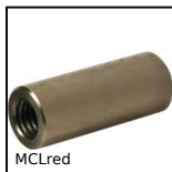
MCLred Manicotto di riduzione, Cilindrico - acciaio