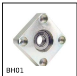
BH01 Cuscinetto radiale flangiato, Montaggio : pressione e colla