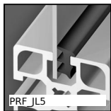
PRF_JL5 Panel accessories, Guarnizione - Ø 5mm