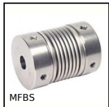
MFBS Giunto a soffietto Inox, Inox - con vite a pressione