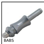
BABS Perno autobloccante a sfere inox, Inox temprato