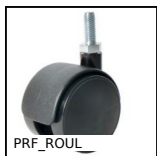
PRF_ROUL Ruota per profili alluminio, Senza freno