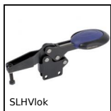
SLHVlok Bloccaggio a leva, A leva orizzontale / base verticale