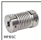
MFBS Giunto a soffietto Inox, Inox - con ganascia di serraggio