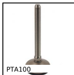
PTA100 Piede snodato con base stampata Ø100, Ø 100