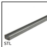
STL Guida con spazzola, Binario