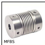
MFBS Giunto a soffietto Inox, Inox - con vite a pressione