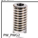
PW_PWG2 Vite senza fine di precisione, Acciaio