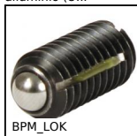
BPM_LOK Pressore a molla con intaglio e puntale a sfera, LONG-LOK - Acciaio