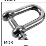
MDR Grillo con chiodo ad occhiello, Acciaio