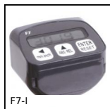
F7-I Visualizzatore multifunzione, Con sensore di posizione integrato