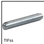
TIFss Tirante tutto filetto - DIN976A, Inox