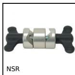
NSR Connettore rinvio d'angolo, Regolabile