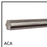
ACA Albero scanalato in acciaio, Acciaio