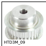
HTD3M_09 Puleggia dentata di trasmissione tipo HTD, HTD3 Alluminio