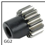
GG2 Ingranaggio dritto rettificato, Acciaio trattato