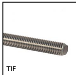
TIF Asta filettata - DIN975, Inox A2