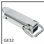
GE32 Chiusura a leva rigida ad anello, Standard