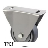
TPEf Ruota per profili alluminio, Fissa