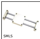
SMLS Tavola lineare, Per lunghezze ridotte