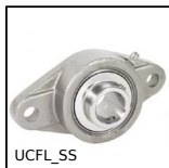
UCFL_SS Cuscinetto a flangia ovale tutto inox, Inox