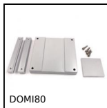
DOMI80 Accessori di collegamento, Piastra