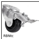
RBNtc Ruota girevole a foro centrale, Acciaio - caucciù - a doppio blocca...