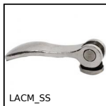
LACM_SS Leva a camma inox, Femmina