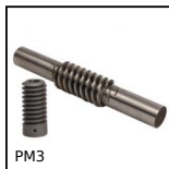
PM3 Coppia ruota e vite senza fine, Acciaio temprato