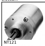
NT121 Riduttore coassiale a treni paralleli, da 20 a 68 Nm - a treni