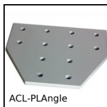
ACL-PLAngle Elementi di giunzione, Collegamento angolare