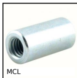
MCL Manicotto cilindrico maschiato, Cilindrico - acciaio