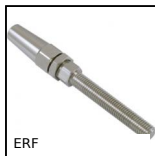
ERF Terminale rapido per cavi, Terminale filettato