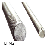
LFM2 Vite trapezoidale acciaio, Acciaio semiduro - 2 filetti