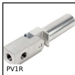
PV1R Braccio portaventosa orientabile, Serraggio standard