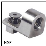
NSP Morsetto base a 90°, Montaggio e regolazione rapidi