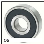
Q6 Cuscinetto radiale a sfere, Acciaio