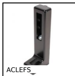
ACLEFS Elementi di ancoraggio, Regolabile