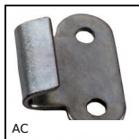
AC Piastrina di riscontro, 15mm