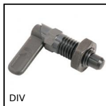
DIV Pistoncino a molla, Bloccabile - Acciaio