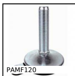
PAMF120 Articulated fixable foot, pressed bolt-down base Ø 120, Ø