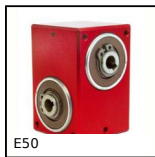
E50 Riduttore a rinvio angolare, da 3 a 41 Nm