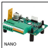
NANO Variatore di velocità 3A, 3 A