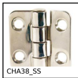
CHA38_SS Cerniera su facciata ad avvitare inox, Su facciata