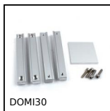
DOMI30 Kit di raccordo, Kit di raccordo XY