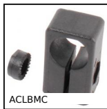
ACLBCM Supporto per sensore per profili alluminio, Porta cellula