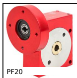
PF20 Riduttore a ruota e vite senza fine, fino a 5 Nm