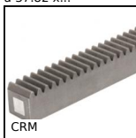
CRM Cremagliera in nylon stampato, Nylon