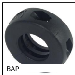
BAP Anello di bloccaggio, Ø10 - Ø20