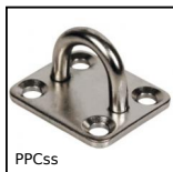
PPC_Ss Piastrina con anello, Inox