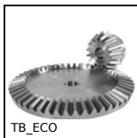
TB_ECO Ingranaggio conico - Acciaio C43 - ECO, 3:1