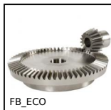
FB_ECO Ingranaggio conico - Acciaio C43 - ECO, 4:1