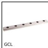
GCL Guida lineare a sfere Eco, economica