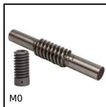
M0 Coppia ruota e vite senza fine , Acciaio temprato