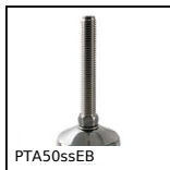
PTA50ssEB Piede snodato con base stampata Ø50, 4000N