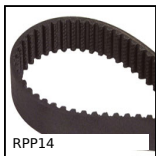
RPP14 Cinghia di trasmissione RPP, RPP14