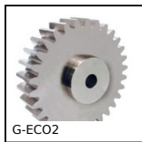
G-ECO2 Ingranaggio dritto acciaio - serie ECO, Acciaio C45