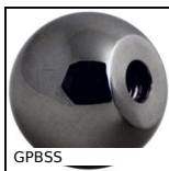
GPBSS Impugnatura sferica femmina filettata, Alluminio