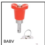
BABV Ball lock pins lockable , Stainless steel