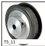
T5_11 Puleggia dentata di posizionamento tipo T, T5 alluminio