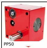
PP50 Riduttore a ruota e vite senza fine, da 6.50 a 12.80 Nm