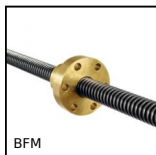
BFM Dado trapezoidale, Bronzo - 1 filetto