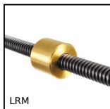
LRM Dado cilindrico in bronzo, Bronzo - 1 filetto