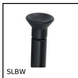
SLBW Pistoncino a molla, Da saldare - Acciaio