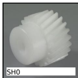
SH0 Ingranaggio elicoidale ad assi paralleli, Plastica lavorata (delrin)