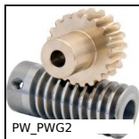
PW_PWG2 Ruota di precisione, Bronzo