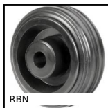
RBN Ruota, Rivestimento in gomma - nucleo in polipropilene