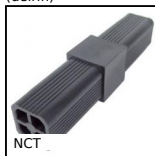
NCT Giunto di collegamento, Ad angolo fisso