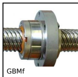
GBMF Dado per vite a sfere, Dado flangiato a circuiti multipli