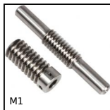
M1 Coppia ruota e vite senza fine, Acciaio non temprato