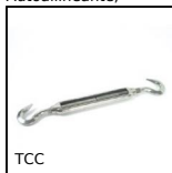
TCC Tenditore, Acciaio