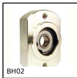
Cuscinetto radiale flangiato, Montaggio con circlips