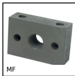
Deceleratore, Flangia rettangolare