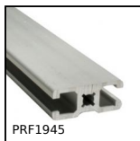
Profilato alluminio standard, 19 x 45 mm