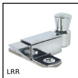
Chiavistello con perno prismatico, Lucchetto a molla