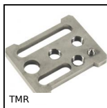
Tenditore rigido, Manuale