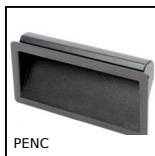
Maniglia da incasso, montaggio a scatto