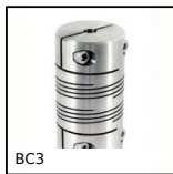
Panamech, Multi-Beam inox, Inox - con ganascia di serraggio