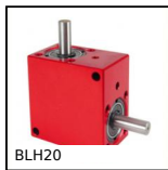
Rinvio angolare a L, da 0.53 a 1.77