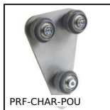
PRF-CHAR-POU Attrezzi, Carrello attrezzi