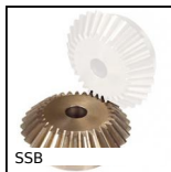
SSB Ingranaggio conico inox, 1:1