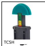
TCSH Tenditore per catena automatico, Con pattino