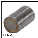
PLM-C Magnete cilindrico di fermo, Magnete di fermo cilindrico