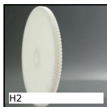
H2 Ingranaggio elicoidale ad assi incrociati a 90°, Plastica lavorata ...