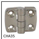
CHA35 Cerniera ad avvitare, Cerniera