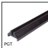
PGT Accessori per pannello, Profilo per pannello scorrevole