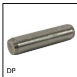
DP Spina cilindrica , standard ISO 2338