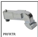
PRFRTR Elementi di giunzione, Giunto di collegamento trasversale