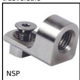
NSP Morsetto base a 90°, Montaggio e regolazione rapidi