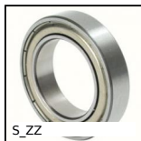
S_ZZ Cuscinetto radiale a sfere, Inox