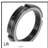
LR Cuscinetti a sfere - Accessorio, Ghiera di regolazione