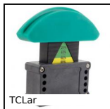
TCLar Tenditore per catena automatico, Con pattino largo