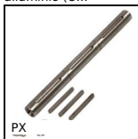
PX Riduttore a ruota e vite senza fine, Albero doppio in uscita per rid...