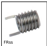
FRss Inseri filettati, Inox