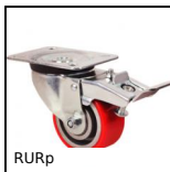
RURp Ruota girevole a doppio bloccaggio, Poliuretano - Mozzo alluminio (U...