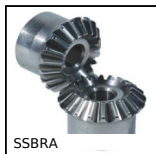
SSBRA Ingranaggio conico inox, 1:1