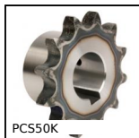
PCS50K Pignone a catena dentatura temprata, 12.7mm (DIN08B-1)