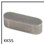
KKSS Chiavetta rettangolare , Inox