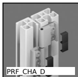
PRF CHA D Cerniera ad avvitare, Scardinabile