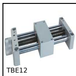
TBE12 Economic mini-table with trapezoidal